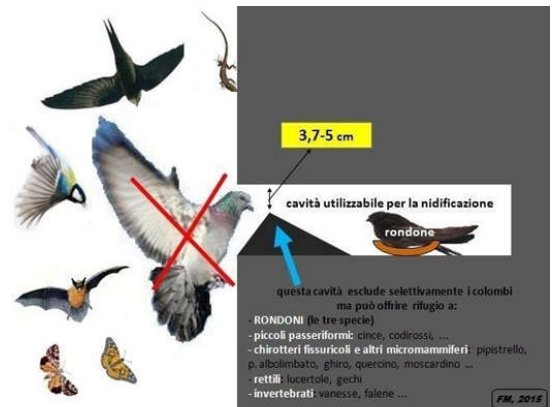
2-Aspetti ed effetti della modifica selettiva di una buca pontaaia. Ferri-M.

http://ilgrol.com/index_file/Page535.htm