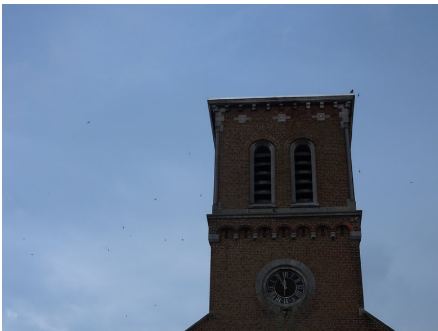
Eglise du Sacré-Coeur d'Ecaussinnes (© Martine Wauters) Soir du 8/07/21: ronde sonore autour du clocher aménagé (© Martine Wauters)

Juillet 2021: je passe voir les aménagements sur place. A mon grand plaisir, j'observe une trentaine de martinets qui tournoient en criant autour du clocher; c'est très bon signe! Je m'attarde donc et, en l'espace d'un quart d'heure, je repère 3 cavités occupées par des nicheurs!