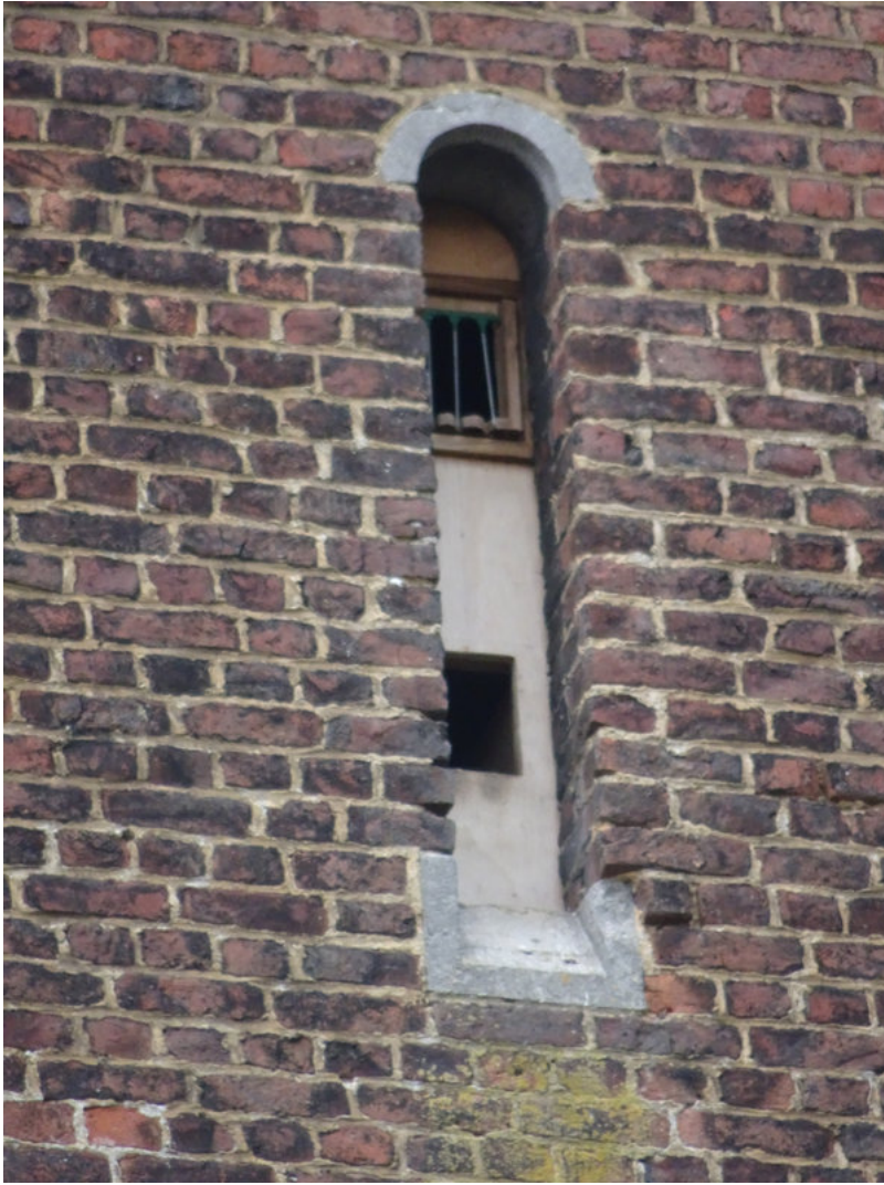
Aménagement pour Effraies des clochers.

Juillet 2021: je passe voir les aménagements sur place. A mon grand plaisir, j'observe une trentaine de martinets qui tournoient en criant autour du clocher; c'est très bon signe! Je m'attarde donc et, en l'espace d'un quart d'heure, je repère 3 cavités occupées par des nicheurs!