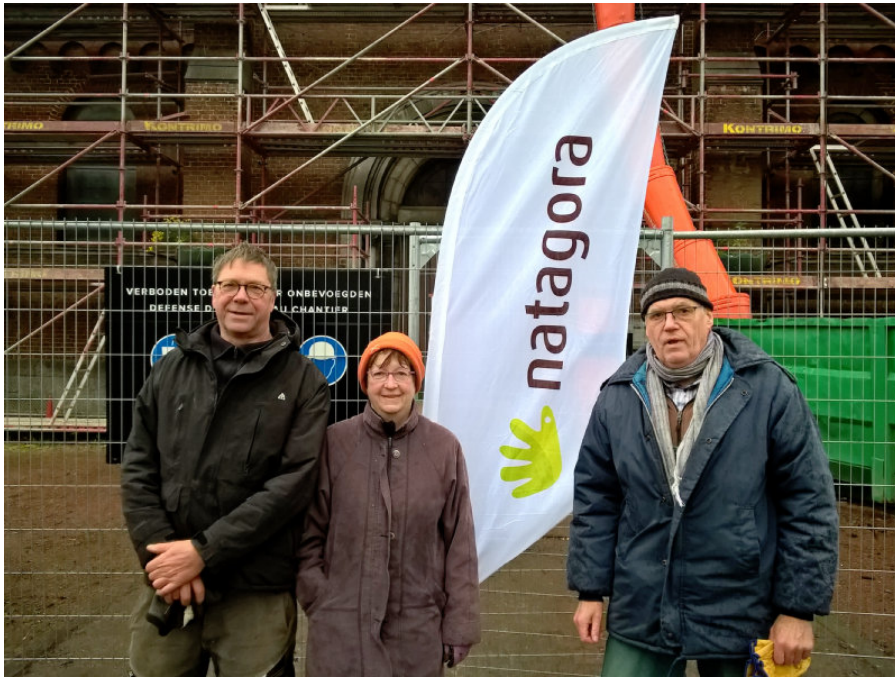
Des bénévoles passionnés : l'équipe de choc.

(Petite précision : cette église, fermée depuis 2021, a été désacralisée en 2019 et sera bientôt réaffectée en espace socio-culturel polyvalent).