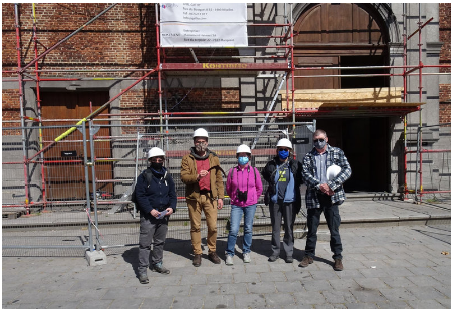
Voici "la valeureuse équipe", représentant un partenariat entre la Commune d'Ecaussinnes, le PCDN "Ecaussinnes Cité Nature", la Régionale "Haute Senne" de Natagora et le GT Martinets

Tous ces projets démontrent une fois de plus que "l'union fait la force", merci à tous!