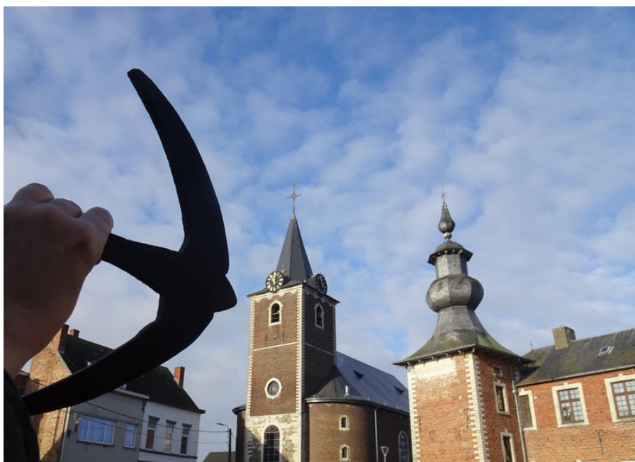
L'église St Martin de Jauche après l'aménagement de ses trous de boulin (A droite : le château de Jauche )

Depuis longtemps, il est établi que les martinets s'installent volontiers dans les églises. Que ce soit en Europe ou même... à Bethléem (Palestine)! Un peu partout, des amis des martinets se mobilisent depuis des décennies pour préserver leurs cavités de nidification... voire pour en créer de nouvelles. En Région wallonne, l'opération Combles et Clochers a longtemps plaidé pour l'accueil de la faune sauvage (y compris les martinets) dans ces bâtiments. Mais cette action était tout doucement tombée en désuétude. Ces dernières années, plusieurs dossiers exemplaires se sont concrétisés en Wallonie. Dans cet article, je vous présente trois aménagements différents de trous de boulin. Le but: empêcher les pigeons de s'y installer et de souiller le bâtiment tout en laissant les martinets y nicher. Dans ces 3 dossiers, le GT Martinets a pu apporter son expertise, mais rien ne se serait fait sans des partenariats fructueux avec des acteurs professionnels, tant privés que publics... mais aussi avec des passionnés locaux!