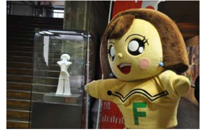
文化の日無料開館(めがみちゃん登場)