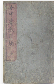
江戸時代の 女子用往来物 (当館蔵)