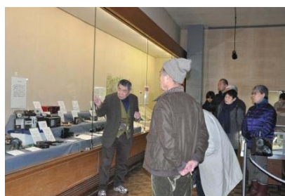
展示解説会のようす

もう一つはわたしのたからである「モノから振り返る昭和の暮らし 終戦から昭和の暮らしや文化をモノから振り返ろうという試みです。懐かしく思い出される方も初めてご覧になる方もいるかと思えます。是非ご見学下さい。