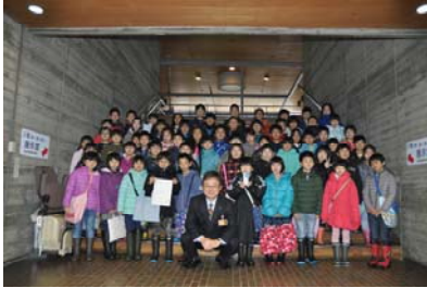
4万人目セレモニー