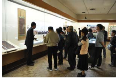
プライム企画展展示解説会